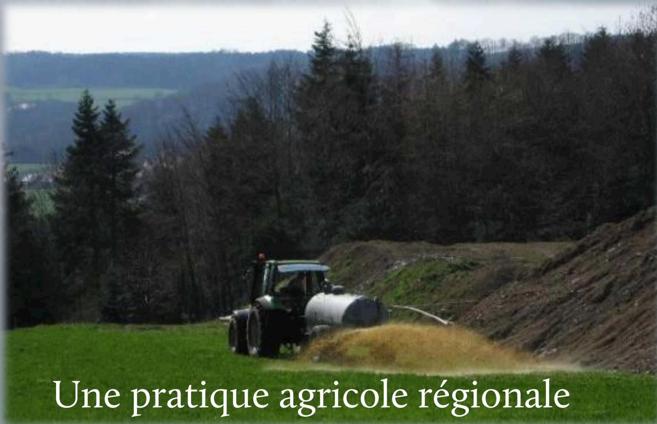
Une pratique agricole régionale

Une étude locale avec les algues vertes de la baie de Saint-Brieuc, et une étude plus globale réalisée par l'expédition TARA