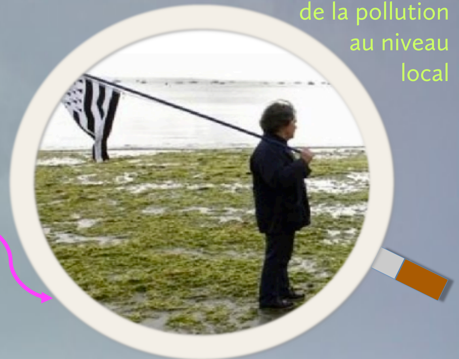
L'impact de la pollution au niveau local